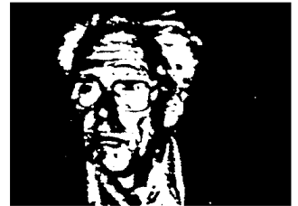
Professor Günther Reichelt

Het ASEV-rapport komt dan tot 10 vestigingsplaatsen, die aanvaardbaar worden geacht: de Eemshaven, de Noord Oostpolder bij Urk, langs het Ketelmeer, de Flevocentrale bij Lelystad, de Wieringermeerpolder, de maasvlakte, Tholen, St Philipsland, Borssele, en op de westerschelde-oever tussen Rilland-Bath en Hoedekenskerke. In de nieuwste plannen worden als voorkeur vestigingsplaatsen in de Noord Oostpolder bij Urk en in de Wieringermeer genoemd. Men wil daar twee maal twee tweekerncentrales neerzetten,