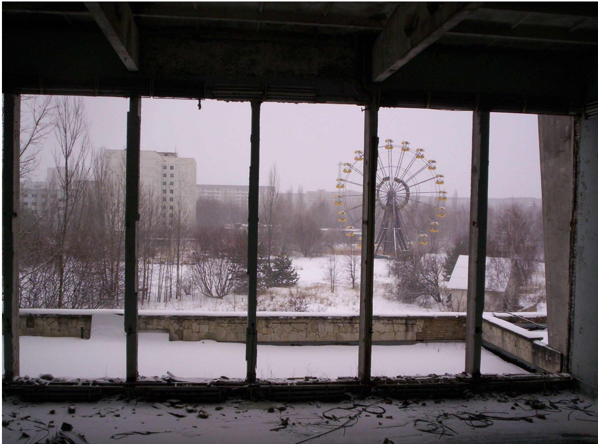
Nu een symbool: het reuzenrad in Pripyat; onderdeel van de kermis die op 1 mei 1986 geopend zou worden. Foto: februari 2006 Keith Adams, Wikipedia

Londense Uranium Institute te spreken, een “waarschijnlijke, maar niet zekere samenvatting van de gebeurtenissen.” 80