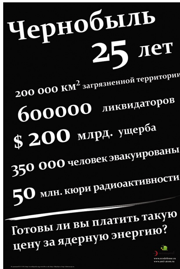
Poster van Ecodefense uit 2011: Tsjernobyl – 200.000 km 2 besmet; 600.000 liquidatoren; 200 miljard dollar schade; 350.000 mensen geëvacueerd; 50 miljoen curie straling. Bent u bereid deze prijs te betalen voor de ontwikkeling van kernenergie?