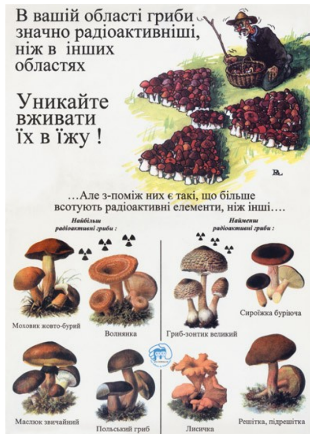
Via posters werd de bevolking in grote gebieden gewaarschuwd voor het eten van zelfgeplukte en besmette paddenstoelen

6. Schildklierkanker kwam veel vaker en veel eerder voor dan verwacht en de verdeling over mannen en vrouwen en jongens en meisjes was anders dan men gewend was. Hoe erger de gebieden besmet waren, hoe meer gevallen van schildklierkanker vastgesteld werden. In