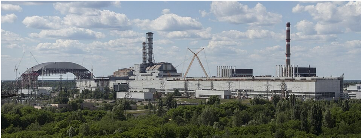
Juni 2013: overzicht Tsjernobyl met links de sarcofaag in aanbouw.

De nieuwe omhulling was in november 2016 klaar. 340 Intussen waren Tsjernobyl-1, -2 en -3 ook stilgelegd en werd geen elektriciteit meer opgewekt bij Tsjernobyl.